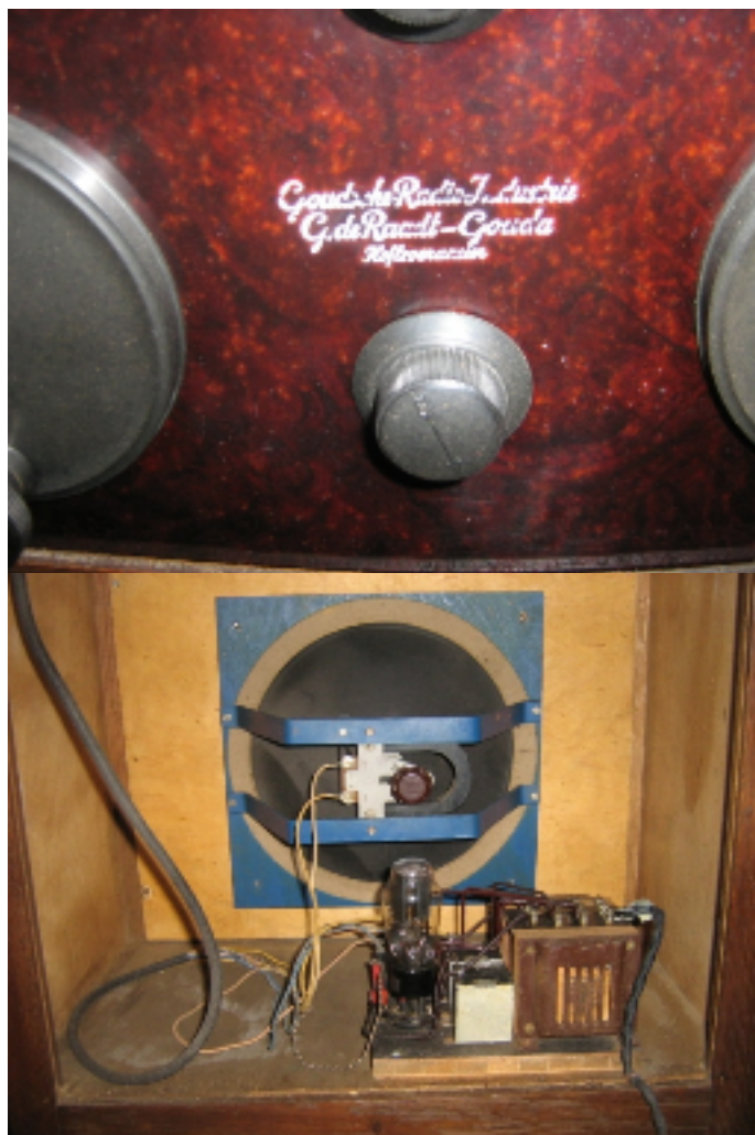
Niet precies bekend wanneer deze radio gebouwd werd.