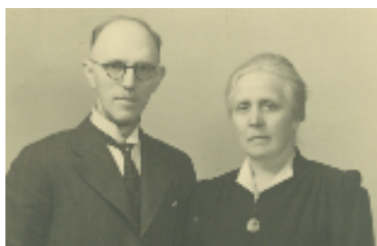
Opa en Oma in de oorlog