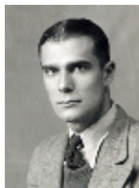
Theo de Raadt, 1938.